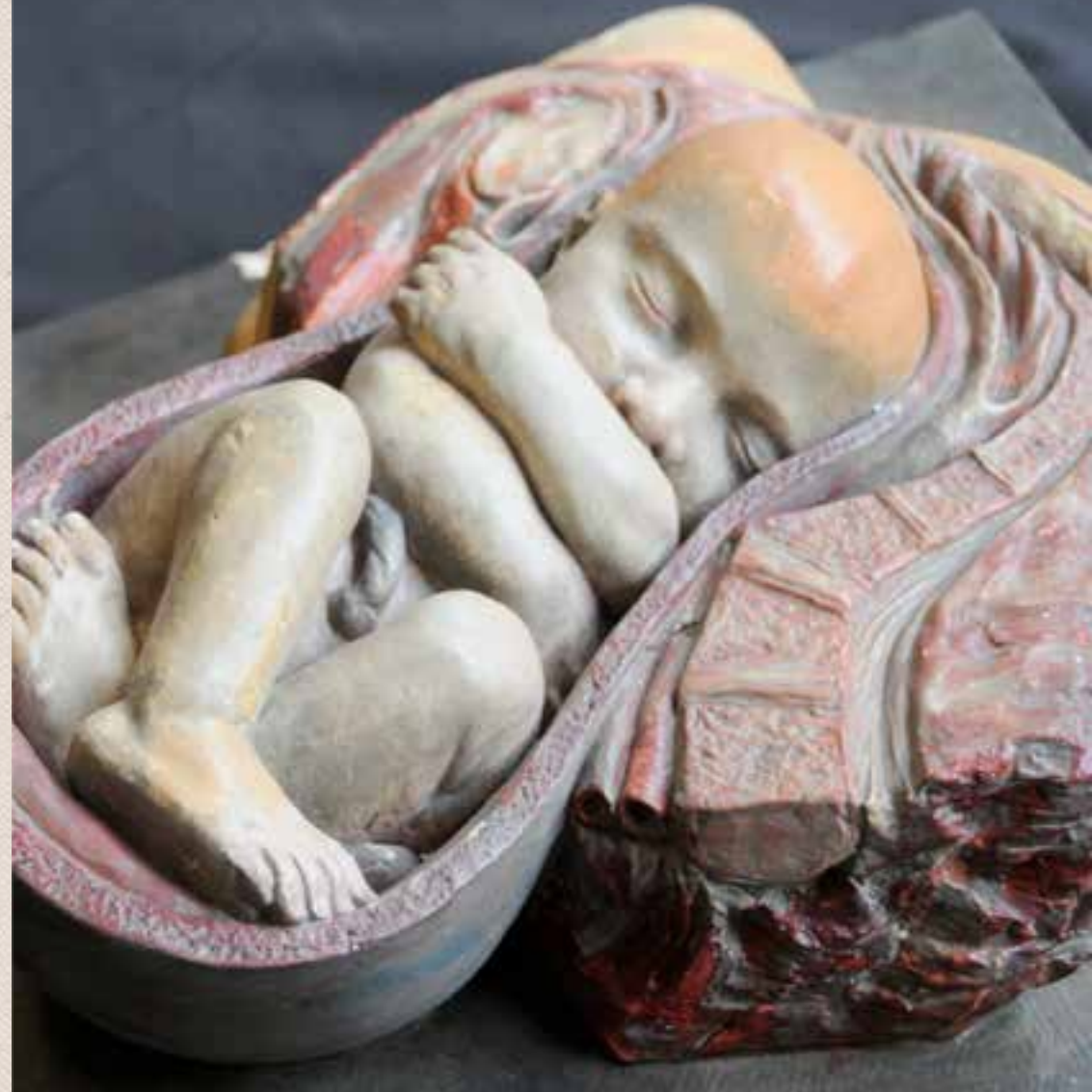
Preparació anatòmica de la fase final del part. Guix policromat. Conjunt escultòric format per quatre preparacions o models anatòmics que representen la fase final del fenomen mecànic del part. Autoria desconeguda. Emprada com a model didàctic al Museu Anatòmic de la Facultat de Medicina de la Universitat de Barcelona, c 1880-1890.

L'exposició tanca amb una mirada a la medicina de les dones a principis del segle XXI. Es tracta d'un context de grans transformacions: al costat d'una creixent divisió de l'expertesa, la feminització de la professió és una realitat, cada cop més a prop de liderar tots els àmbits institucionals laborals.